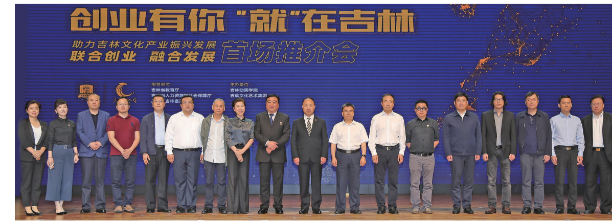
6月11日,由吉林省教育厅、吉林省人力资源和社会保障厅、共青团吉林省委联合指导,吉林动画学院、吉动文化艺术集团主办的“创业有你‘就’在吉林”助力吉林文化产业振兴发展首场推介会在吉林动画学院隆重召开,与会嘉宾合影。