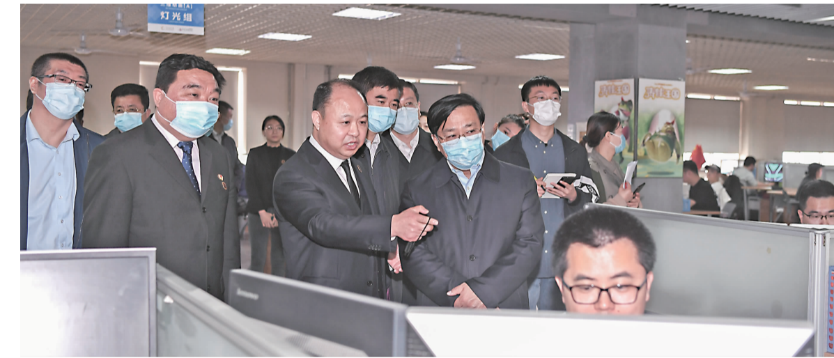
4月23日,省委副书记、省长韩俊走进我校学产对接实践教学平台,了解文化创意制作、动画产业人才培养模式等情况。校长郑立国陪同调研。