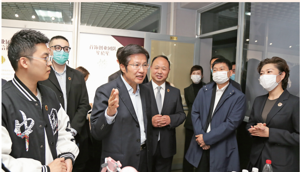
10月14日,全国政协副主席、全国工商联主席高云龙来到吉林动画学院调研。听取吉林动画学院院长郑立国就学校历史沿革、发展情况、办学特色的介绍,并深入了解学校学产对接、大学生创业就业情况。