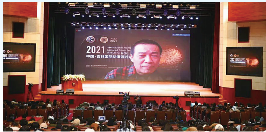
中国电影集团艺术委员会主任、中影集团副总经理江平