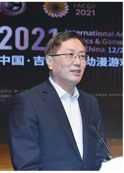
中共吉林省委宣传部副部长张志伟出席开幕式并致辞。