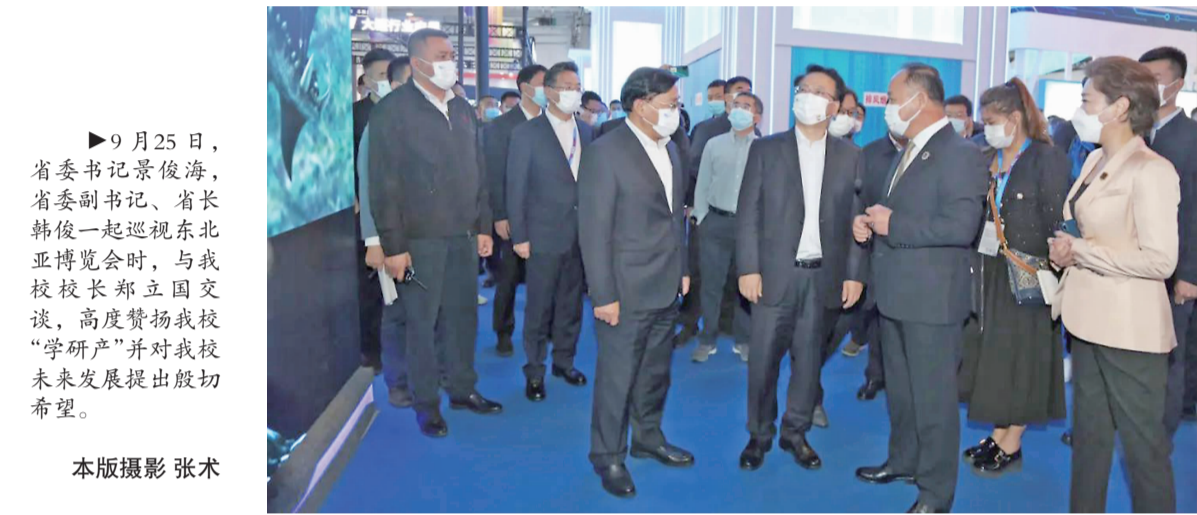
9月25日,省委书记景俊海,省委副书记、省长韩俊一起巡视东北亚博览会时,与我院校长郑立国交谈,高度赞扬我校“学研产”并对我校未来发展提出殷切希望。