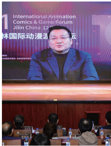
中国动画学会常务副会长、央视动漫集团董事总经理蔡志军通过视频方式向大会致辞。