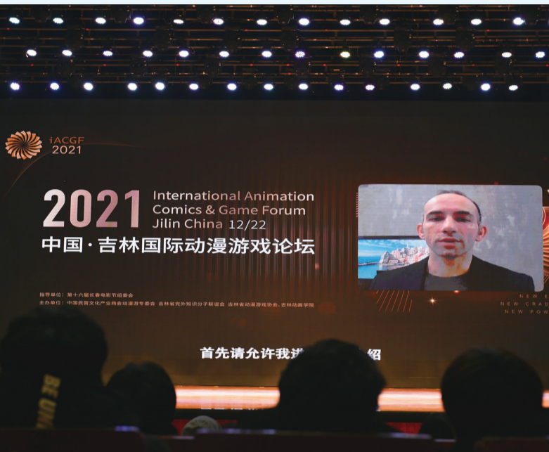
奥斯卡最佳特效影片《盗梦空间》《雨果》特效总监,上海焕身文化传播有限公司执行董事、电影制片人米奥德拉格·科伦坡

我的经验告诉我,软件其实并不重要,更重要的是艺术家的技能。不管你用什么软件,比如 Maya、Max、CINEMA 4D、Softimage、Unity、Unreal,这些都不重要,真正重要的是怎么使用这些软件,也就是技能。知道了技能就比如知道了捷径,作为一名艺术家,技能是必要的。艺术家,是指与相关教育背景、艺术背景的人。当你认为自己是艺术家时,那么不管你参与什么项目,你都实现照片写实感。软件是一个工具,会将你的构想展现出来,但是如果你没有技能,这个工具对你来说就是没用的所以技能比软件更重要。