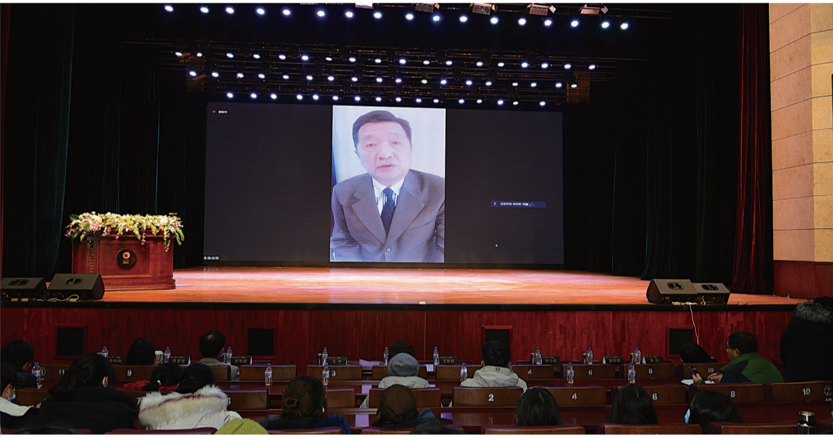
北京电影学院原校长、博士生导师,中国电影家协会副主席张会军