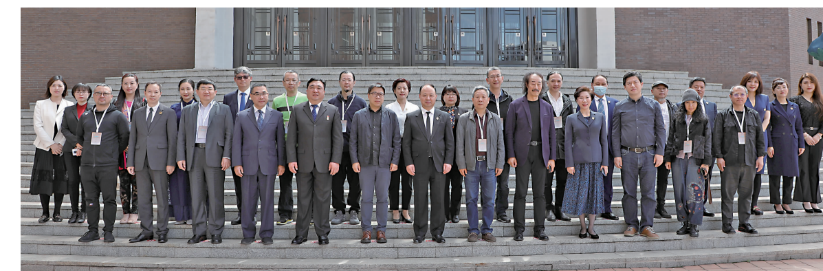
5月16日,2021吉林动画学院动画教育发展论坛隆重举行,校领导与专家合影。