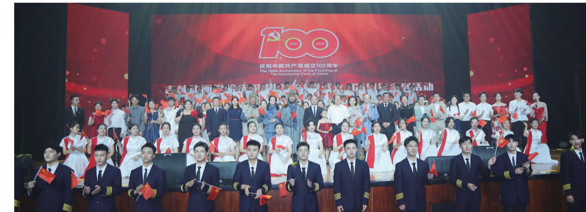
6月23日晚,吉林动画学院庆祝中国共产党成立100周年系列活动颁奖典礼暨文艺作品汇演在学校文化艺术中心隆重举行,校领导与演职人员合影留念。